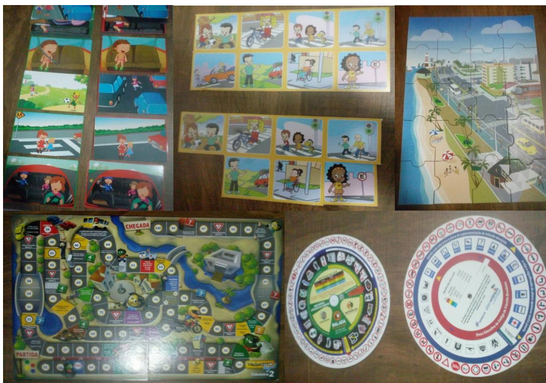
Figura 1. Jogos pedagógicos sobre educação para o trânsito produzidos para uso no Projeto: “Jogo atitudes certas e erradas”; “Jogo da memória”; Quebra-cabeça “Minha Cidade”; “Jogo de tabuleiro”; “Roleta da sinalização”.